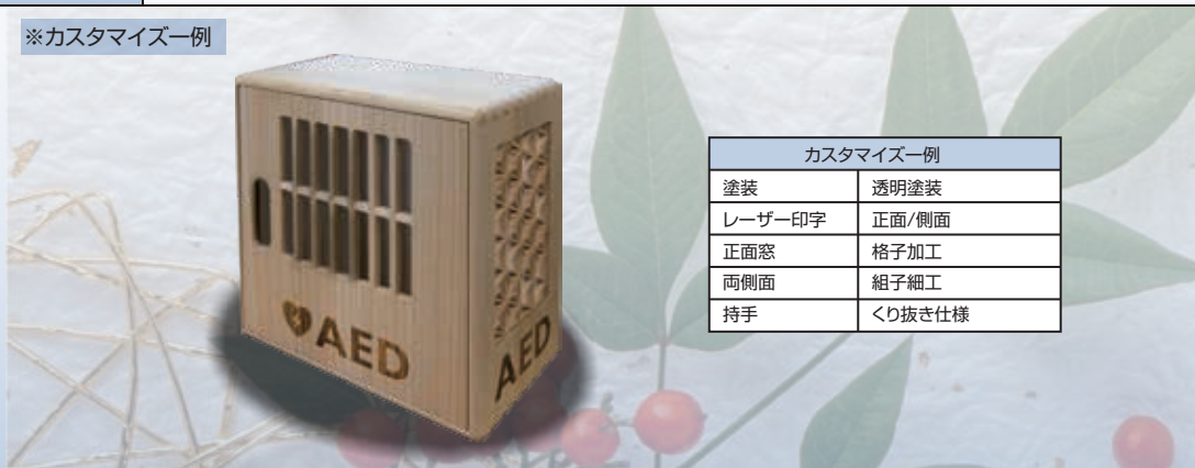
※カスタマイズ一例